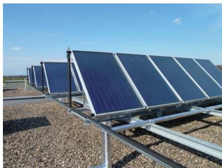
Solární systém na bytovém domě Praha