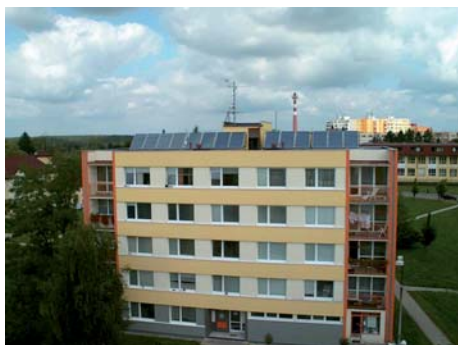
Solární systém na bytovém domě Bechyně